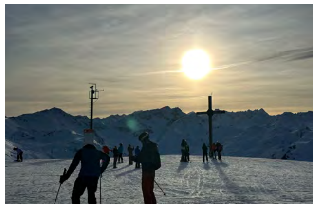
Abendlicher Ausblick am Gipfel der Axamer Lizum.