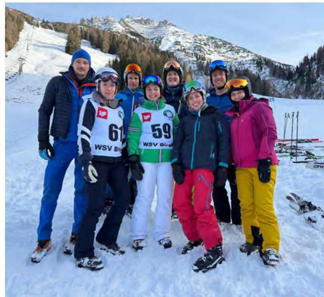
Die Landesgruppe Steiermark mit JI-Bundesvorsitzender Julia Aichhorn beim traditionellen Skirennen.

Die Tage in der Axamer Lizum haben einmal mehr gezeigt, wie wichtig solche Formate für die Junge Industrie sind: Sie schaffen Raum für Begegnung, stärken das Netzwerk und verbinden fachlichen Austausch mit gemeinsamen Erlebnissen. Die Vorfreude auf das nächste JI-Skiwochenende in der Steiermark ist damit bereits geweckt!