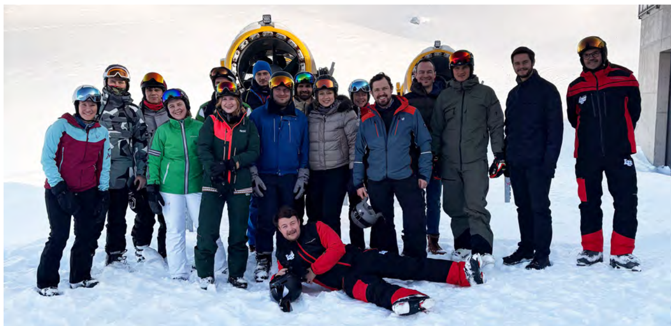
Einige Teilnehmerinnen und Teilnehmer aus ganz Österreich im Rahmen des JI-Skiwochenendes 2026.