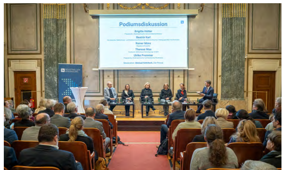
Die IV lud zu einer Diskussion der Hochschulstrategie.

mehr Effizienz, mehr Innovation und einen attraktiven Standort Österreich.